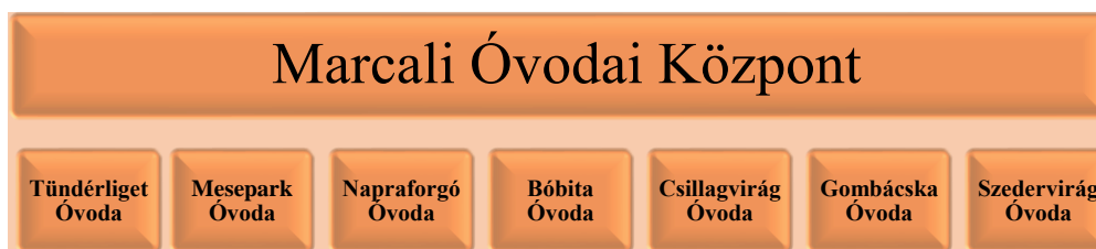
1. ábra MÓK szervezeti felépítés